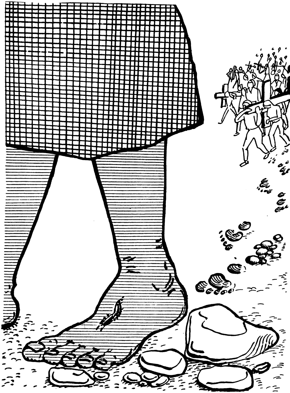
Maria, Mãe de Jesus, 07