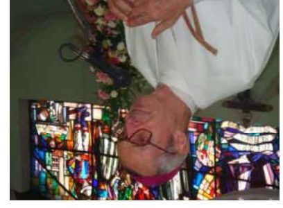
Mons. Tito Solari, Arzobispo de Cochabamba: La Iglesia necesita rejuvenecerse, ser joven a través de ustedes para poder llevar vida y esperanza al continente.

En la parroquia Virgen del Rosario en Vinto (Cochabamba) se ha celebrado la eucaristía de inauguración del XVI encuentro latinoamericano de responsables de pastoral juvenil. La celebración eucarística fue presidida por Mons. Tito Solari, Arzobispo de Cochabamba, en un marco de fiesta juvenil algo característico de estos encuentros. Durante su homilía Mons. Solari recordó a los delegados que no solo se representan a sí mismos sino a los jóvenes del continente juvenil de América Latina por ello deben asumir la conciencia de que son amados por Dios, "espero que estos días de encuentro experimenten este amor que